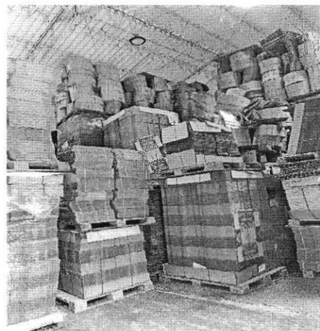
Bodega dos materia prima.